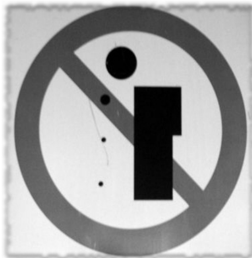
panneau « interdiction de cracher », Inde

articles 706.54, 706.55 et 706.56 du Code de Procédure Pénale.